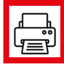
Impresora No Láser