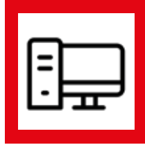
Computadores y Portátiles